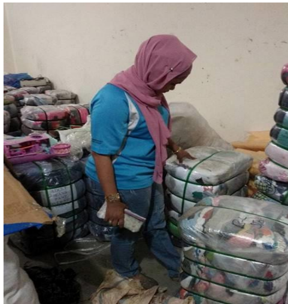
Caption : Isteri beliau bersama stok-stok baru.

Lain-lain (contoh : proses penghasilan produk, penglibatan dalam aktiviti lain, dsb)