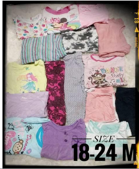
Caption : Contoh promosi terbaru beliau.

Lain-lain (contoh : proses penghasilan produk, penglibatan dalam aktiviti lain, dsb)